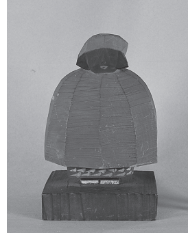
木村五郎《赤いマント》