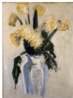
Moriye Ogihara 《Yellow Daffodils》