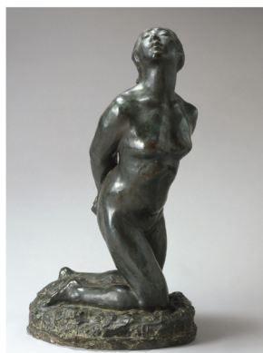
Moriye Ogihara 《Woman》1910

Admission half price for persons with disability. ※持有殘障者手冊者可享半價優惠。 ※持有身障者手冊可享半價優惠。